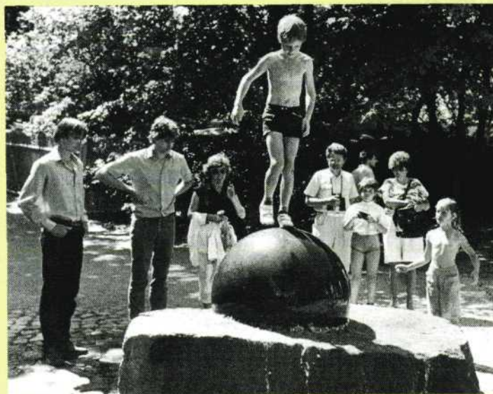
Met gemak laten wentelen van een stenen kogel van 1000 kg..

werking van de bezoeker. Er zijn zo'n 270 verschillende objecten, grotendeels overdekt (onder een veelvormig tentdak en in een 30 m. hoog bamboekasteel) maar ook in de openlucht. Bijgaande foto's geven maar een flauw idee.